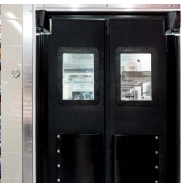
Portes battantes, fini noir