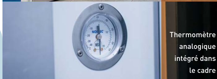
Thermomètre analogique intégré dans le cadre

Contactez Norbec pour en savoir plus sur la gamme complète d'options et d'accessoires offerts pour tous les projets de chambres froides.