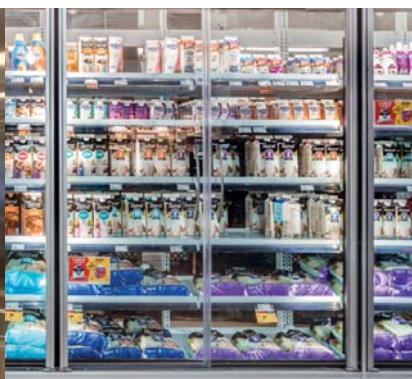
Portes en verre