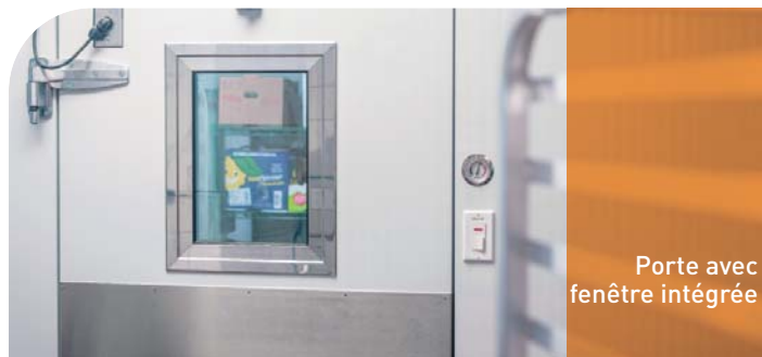
Porte avec fenêtre intégrée