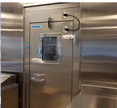
Porte plane à charnières en acier inoxydable