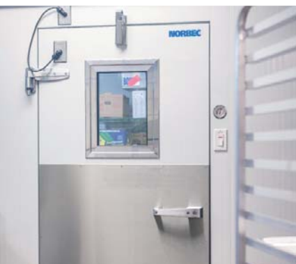
Porte plane à charnières en acier, fini blanc

Une résistance thermique est intégrée aux portes afin de limiter le transfert de chaleur, ce qui entraîne de la condensation et l'accumulation de glace. Le cadre intégré au panneau offre une finition attrayante et permet un nettoyage simple et efficace, tandis que les renforts garantissent une résistance et durabilité accrues. De plus, la rainure pour le fil chauffant le rend plus accessible et ainsi plus facile à remplacer.