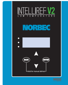
INTELLIREF V2 BASSE TEMPERATURE + DÉGIVRAGE