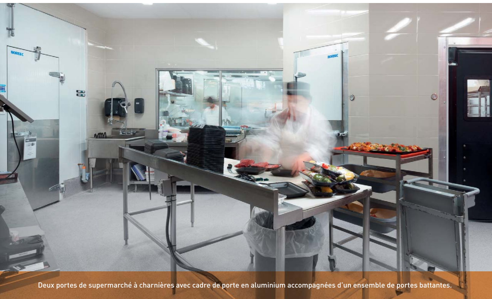
Deux portes de supermarché à charnières avec cadre de porte en aluminium accompagnées d'un ensemble de portes battantes.

Configurations multiples disponibles : réfrigérateurs, congélateurs, combinaisons, entreposage réfrigéré ou à sec. Nos solutions s'adaptent à tous les besoins pour optimiser n'importe quel espace.